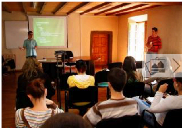
Desarrollo de un curso de verano de la Universidad de Oviedo en la Casa de la Buelga en agosto de 2011.